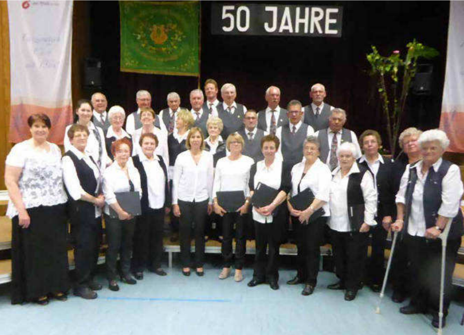
Der Männergesangsverein in Hochstadt besteht seit 157 Jahren. Vor 50 Jahren kam der Gemischte Chor dazu.