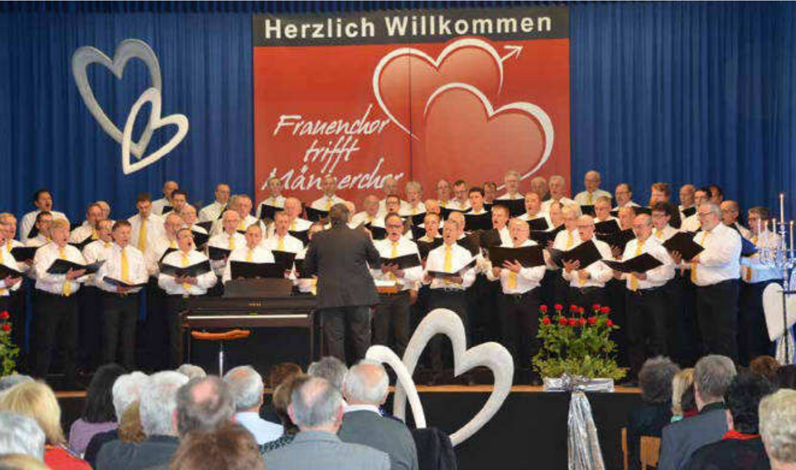
Von wegen: Sie konnten nicht zueinander kommen – Sie kamen, sangen und begeisterten in Hermersberg, Mann und Frau!