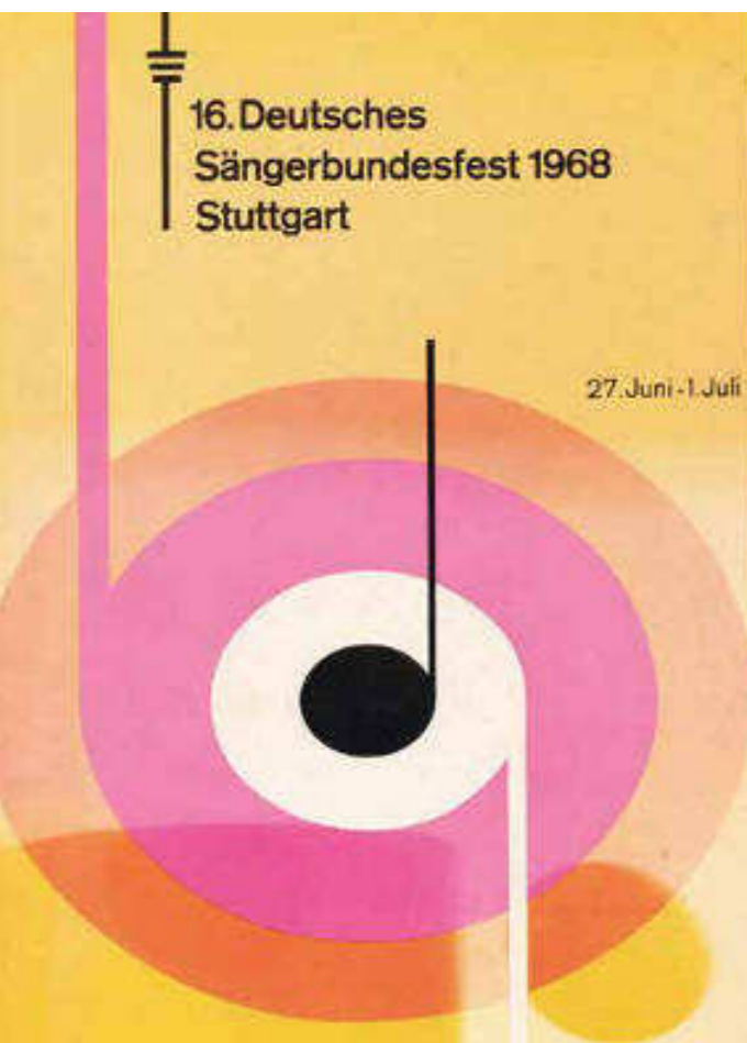
Stuttgart 1968: Festbuch und Fest-Medaille ganz im Zeichen der »nüchternen Jahre«