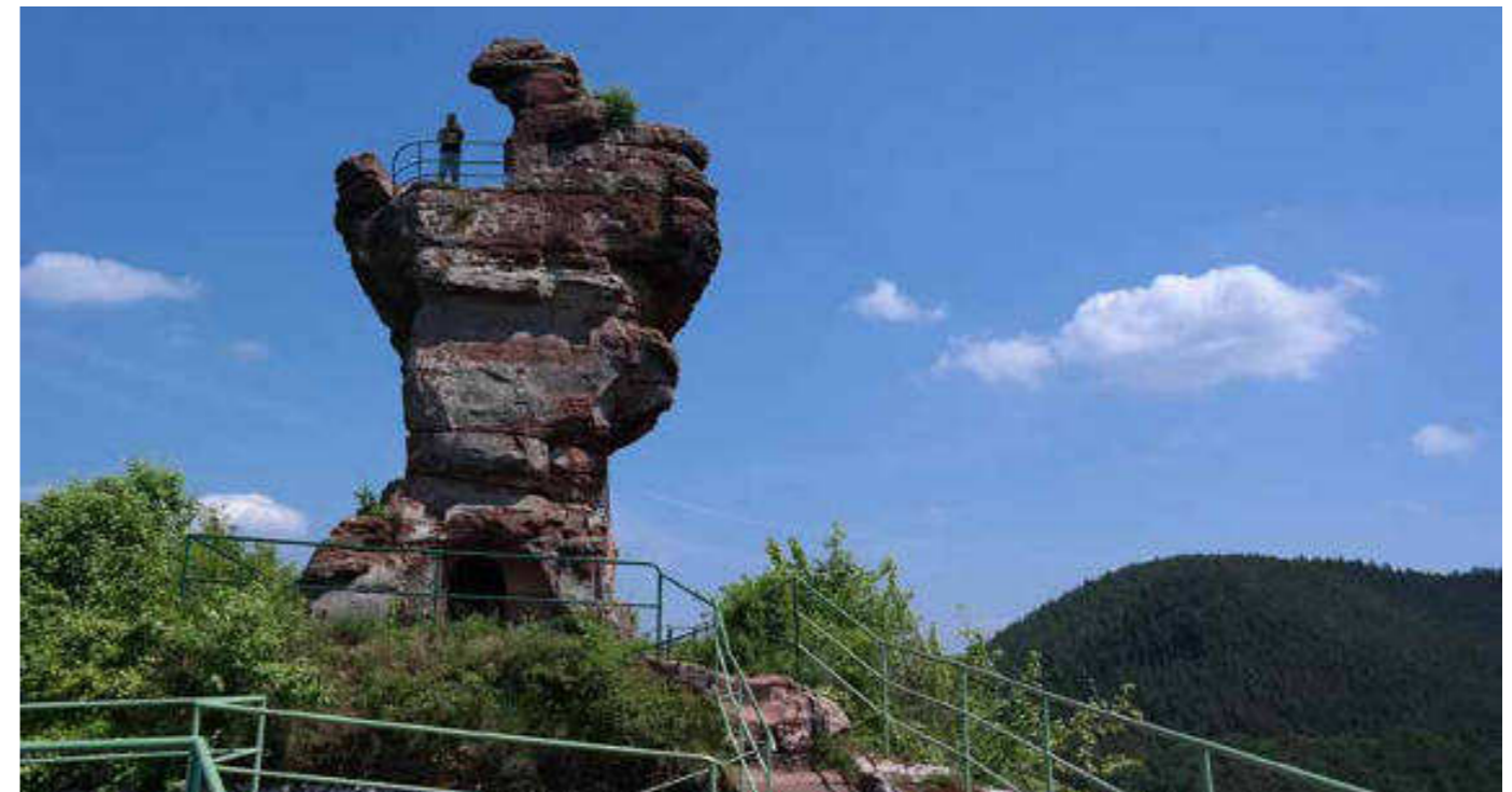
Warum der Turmrest der Burgruine Drachenfels im Volksmund »Backenzahn« genannt wird, zeigt dieses eindringliche Erinnerungsbild an den letzten Zahnarztbesuch. Wie wär's mit einem Wochenendausflug in den Südtteil des Pfälzerwaldes?!

Redaktionsschluss für die Ausgabe Juli/August 2016 ist der 20. Juni 2016 .