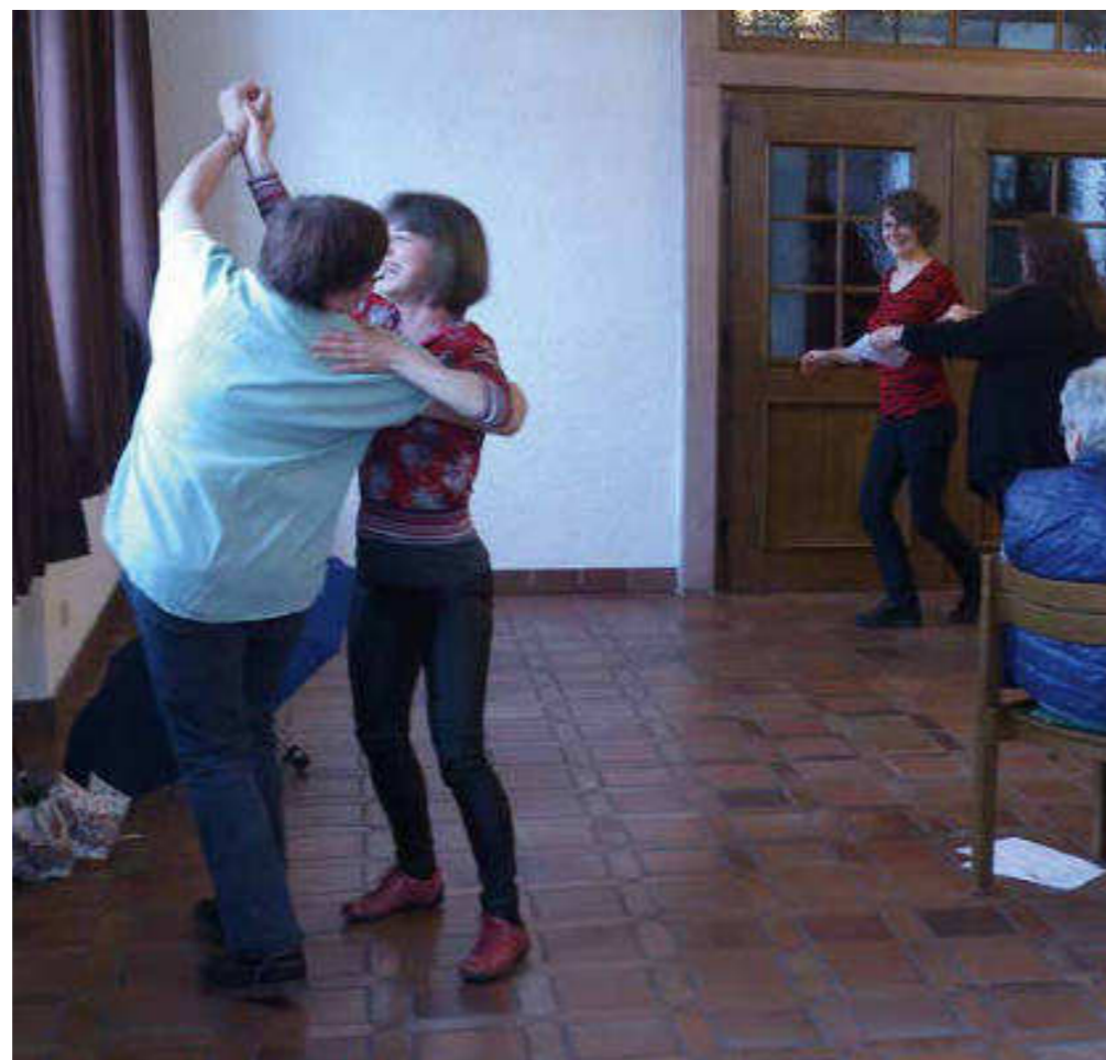
Tanz, Bewegung und Lockerheit waren wichtige Elemente der Stimmbildung in Minderslachen

Übungen zum stimmlich gezielten Sprechen in unterschiedlichen Lautstärken und Tonhöhen unter den Überschriften »Leise oder Laut?« oder »Tief oder Hoch?« sowie rhythmische, bewegungsmäßige Verstärkung des stimmlichen Ausdrucks wurden mit unterschiedlichen Kanons trainiert. Die belebende Sing-Gymnastik mit Übungen wie »Fasse deinen Kopf im Nacken« oder »Schenkel, Bauch und Po« brachten Begeisterung, obwohl sie für die meisten Neuland darstellten. Höhepunkt war jedoch die »Tangostunde«, bei der es singend im Wiegeschritt durch den Saal ging.