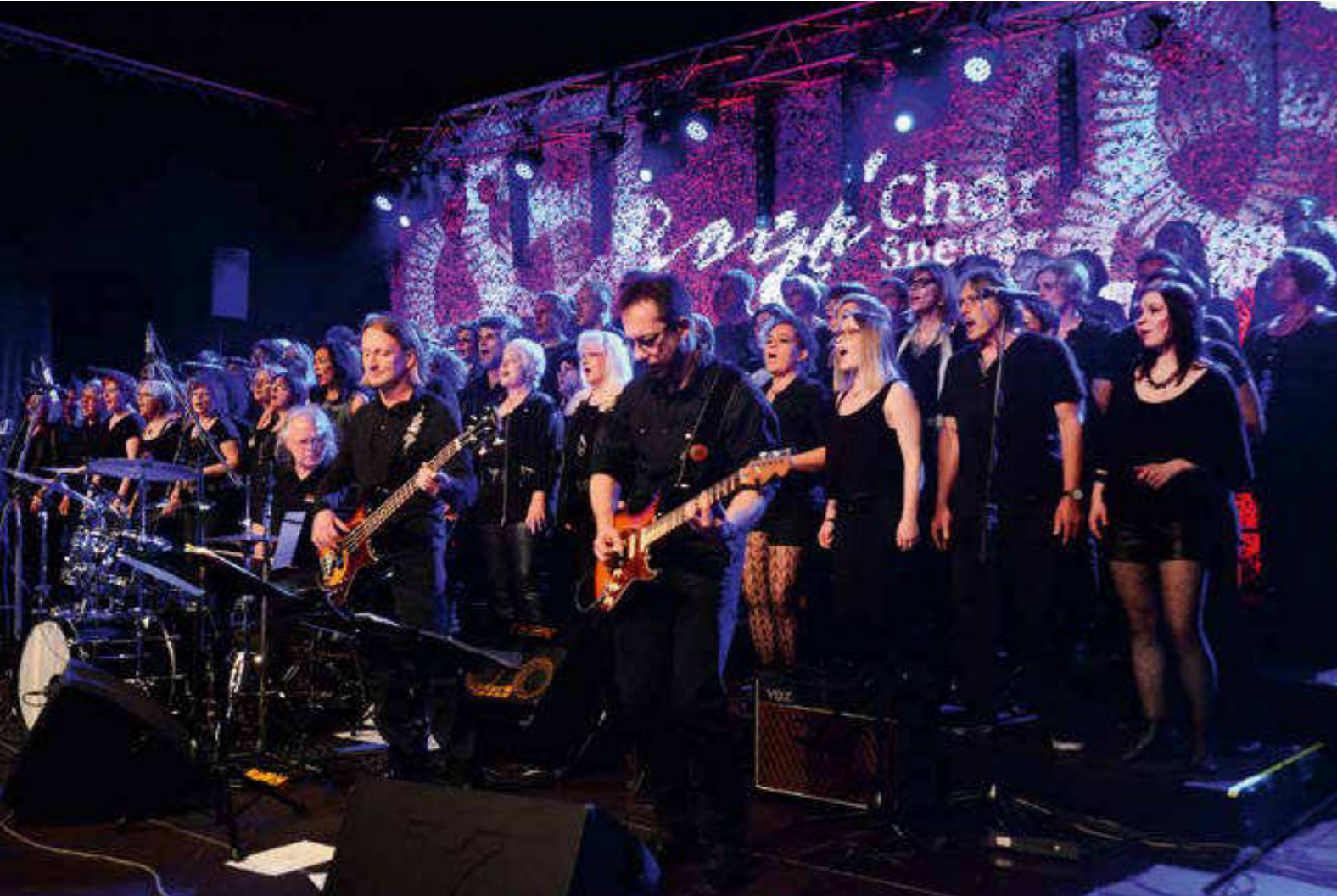
»Das war eines unserer besten Konzerte« meinte nicht nur der Rockchor Speyer, sondern über 900 begeisterte Zuschauer.

Wunsch in Erfüllung, unterstützt vom Chorverband aus Mitteln der Glücksspirale.