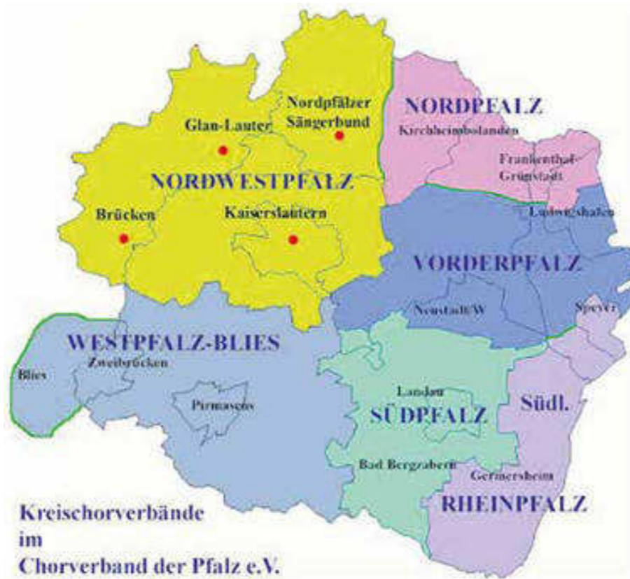
Kreischorverbände im Chorverband der Pfalz e.V.