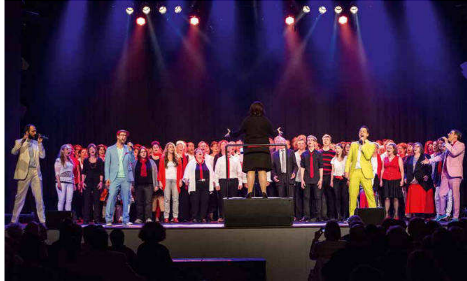
Wo immer die A-Cappella-Gruppe Maybebob mit Jungen Chören arbeitet, ist die Begeisterung groß – hier beim Abschlusskonzert

heit aber auch die eifrige Teilnahme, die hohe Konzentration, das Engagement. Die Stimmung war auch bei den Zuschauern völlig gelöst und grandios.