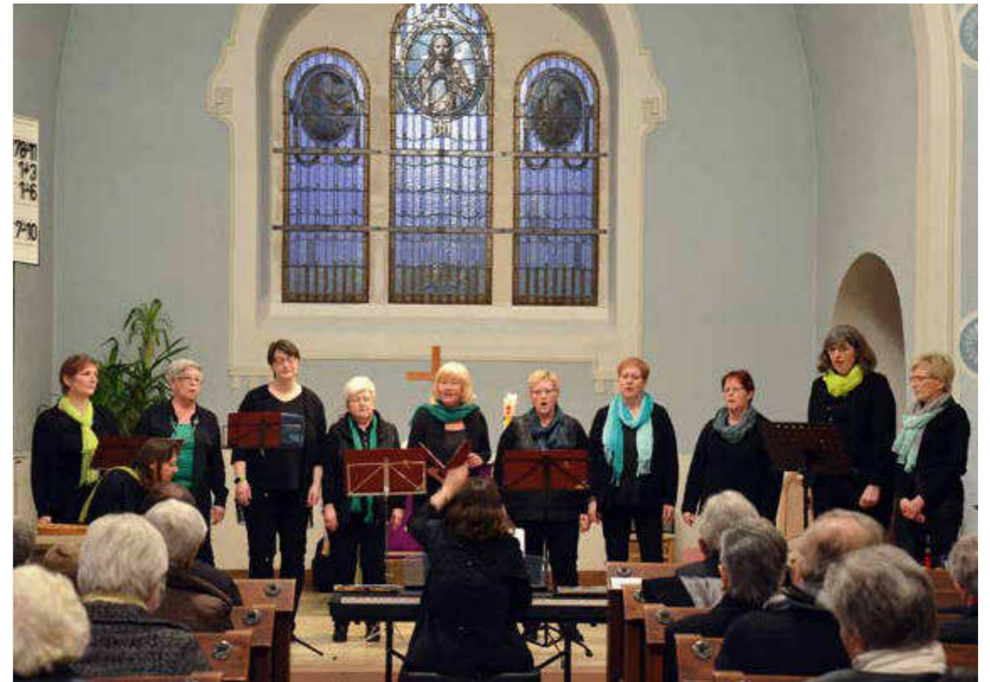
Kirchenkonzert »Von Bach bis Gabalier« in Siegelbach, hier mit dem Frauenchor Kreimbach-Kaulbach

Liedernachmittag mit Ehrungen in Hinzweiler